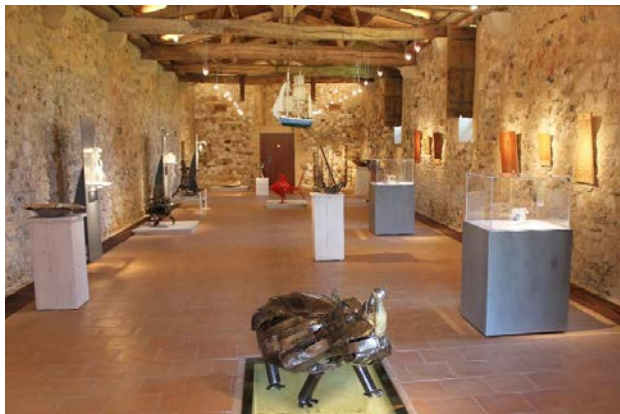
Exposition Les traversiers des arts 2013, Tonnellerie Brouage France

Comité de sélection : Jérôme Durand et Bernard Gautier (Syndicat Mixte de Brouage - France) et Carole Frève (artiste verrier et évaluatrice pour le CMAQ).