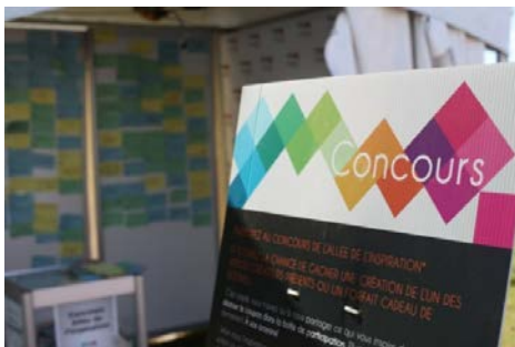
Kiosque concours de l'Allée de l'inspiration

Le concours de l'allée de l'inspiration, présenté par DeSerres, invitait les visiteurs à se faire photographier devant le mur de l'inspiration et à diffuser leur photo dans leurs réseaux sociaux.