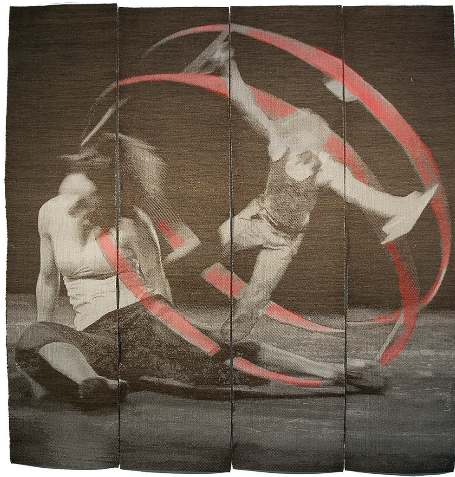
Un orteil dans le vide, tissage Jacquard, 2011 Œuvre d'expression